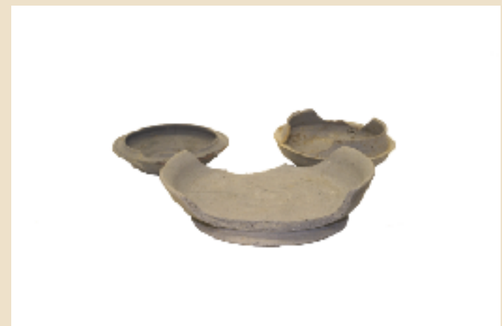
古墳~奈良時代の須恵器