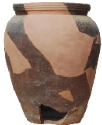
堀跡の近くで出土した備前焼大甕