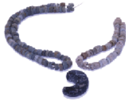
古墳時代の滑石製勾玉・白玉