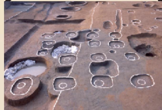
飛鳥時代頃の掘立柱建物跡