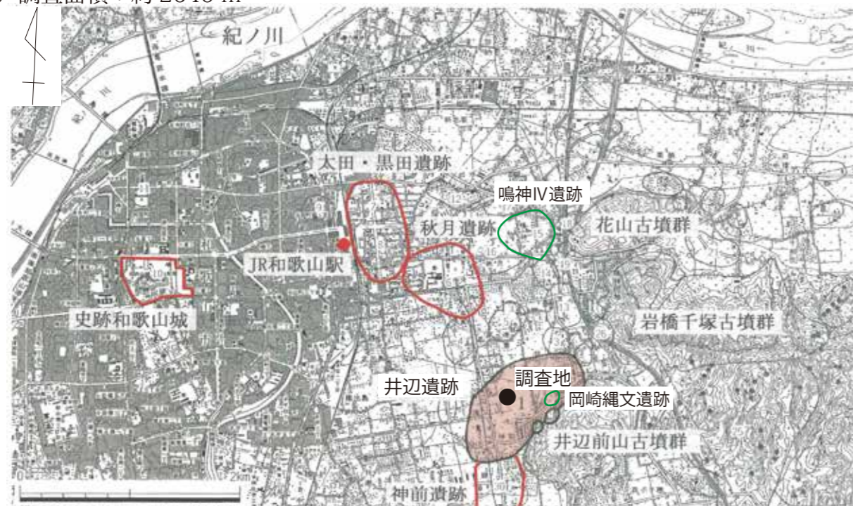
第1図 周辺の遺跡分布図